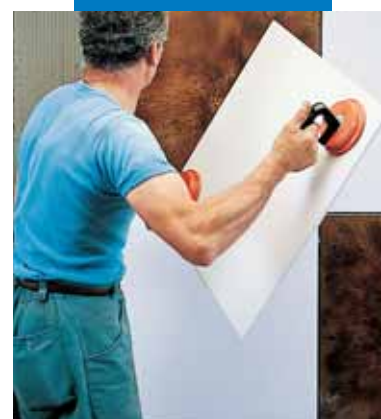
Τοποθέτηση ΚΕΡΑΙΟΝ πάνω σε τοίχο