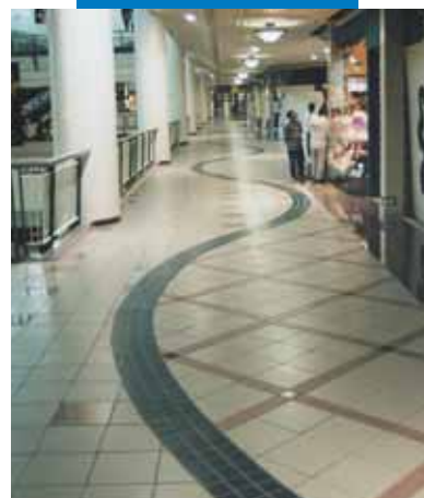
Пример укладки керамической плитки в коммерческом центре – Филинвест Фестивал Суперхол – Манила (Филиппины)