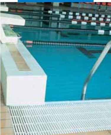
Пример использования Keracrete и Keracrete Powder для укладки мозаики в плавательном бассейне