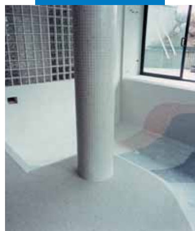
Пример укладки мозаики