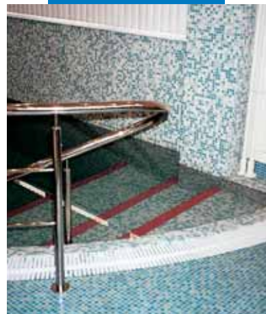
Пример укладки стеклянной мозаики