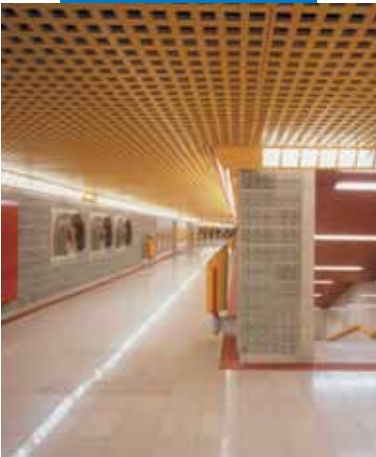
Пример укладки панелей из гранитной крошки в метрополитене - 3-я ветка - Милан (Италия)