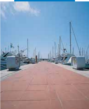
Новый порт в Чивитавеккье: укладка терракотовой наружной напольной плитки с помощью Keracrete

При укладке стеклянной мозаики на бумажной основе, особенно светлых тонов, следует пользоваться Keracrete с белым порошком Keracrete Powder White .