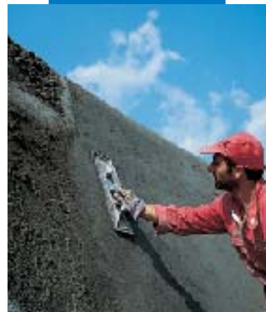
Φινίρισμα του Mapegrout T40 με τριβίδι