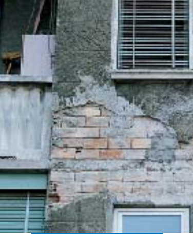
Αποσθρωμένη πρόσοψη κτιρίου που χρήζει επισκευής