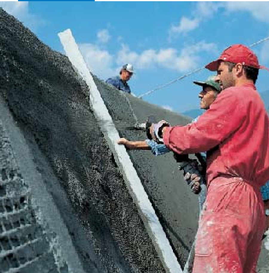
Εφαρμογή του Mapegrout T40 με συσκευή ψεκασμού

την απομάκρυνση του νερού, χρησιμοποιήστε, αν χρειαστεί, πεπιεσμένο αέρα ή σφουγγάρι.