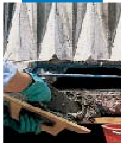
Επισκευή μπαλκονιού με Mapegrout T40